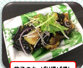
茄子のさっぱり揚げ浸し

揚げ鯖と素揚げしたなす、れんこん、赤パプリカ、ししとうを合わせ、本品に赤唐辛子を加えて和えた南蛮漬け。