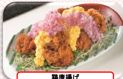
鶏唐揚げ ～ピンクタルタル仕上げ～