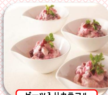
ビーツ入りカラフルポテトサラダ