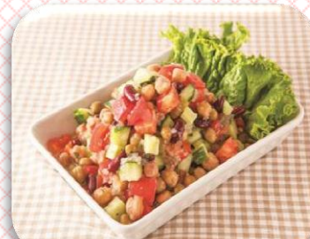
トマトと豆のマリネサラダ

刻んだ玉ねぎが具材によく絡み、ワンタッチで手作り感のあるメニューが提供できます。